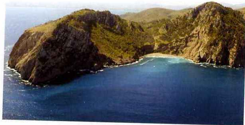
Playa de Coll Baix con el cabo Menorca amenazador a la izquierda.

además de otra más pequeña al N. El Cabo del Pinar es una zona militar, y está prohibido desembarcar en las calas y a veces la entrada también está restringida por boyas. Fondear en 5-7 m (menos si se autoriza la entrada a las calas), en arena y algas. El tendedero es desigual. Es un lugar que frecuentan los excursionistas desde Pollensa y puede estar muy lleno.